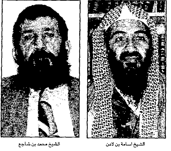
الشيخ محمد بن شجاع

لكن من عام، وجرى نقل مقر إقامته من جبال اباد الى اقليم قندهار معقل قيادة الطالبان، بحجة حمايته واتباعه من مسقطات امريكية لإخفائه، ولكنه أخذ يعاود نشاطه بشكل تدريجي في الايام القليلة الماضية، حيث ارسل برقية تحزية الى الرئيس السوداني عمر البشير بمناسبة وفاة نبيه الزبير، كما اصدر فتوى الجهاد ضد القوات الامريكية مع قادة الجماعات الاسلامية المتطرفة الاخرى. ويؤكد خديرة في نشطة الجماعات الاسلامية ان محاولات بن لادن للخروج من باكستان والانتقال الى الجزيرة العربية، تأتي بسبب الضعف الذي اصاب حركته بسبب انشقاقات وقعت فيها، خاصة من قبل وزيره ماليته الذي استسلم للسلطات السعودية وسلمها اسرازا كخبرة حول عملياته المالية واستثماراته في الخارج، علاوة على نجاح السلطات السعودية في اعتقال المشتري من اتاعه، وتكثيف الاجراءات الامنية حول امكان تجميع القوات الامريكية على اراضيها، وقد نقل القوات الى مناطق آمنة مثل قاعدة الخرج. واعرب احد هؤلاء الخبراء عن اعتقاده بان بروز خلافات بين الحكومة السعودية والقبائل الجنوبية اليمنية في صعدة وادي العطفين قد يهيئ - في المدى الامم لادن وانصاره للتصحر، واعداد تجميع صفوفهم في المناطق الجبلية الوعرة التي يصعب الوصول اليها بالبناديق والسيارات، مما يجعلها اكثر امانا من نظيراتها في جبال اباد او قندهار.